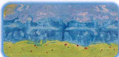
Marie Bode 40x50cm, Mischtechnik auf Papier

Ines Legewie - freischaffende Künstlerin - Atelier im Hinterhof Hüttweg 29 45889 Gelsenkirchen 0172/2600066